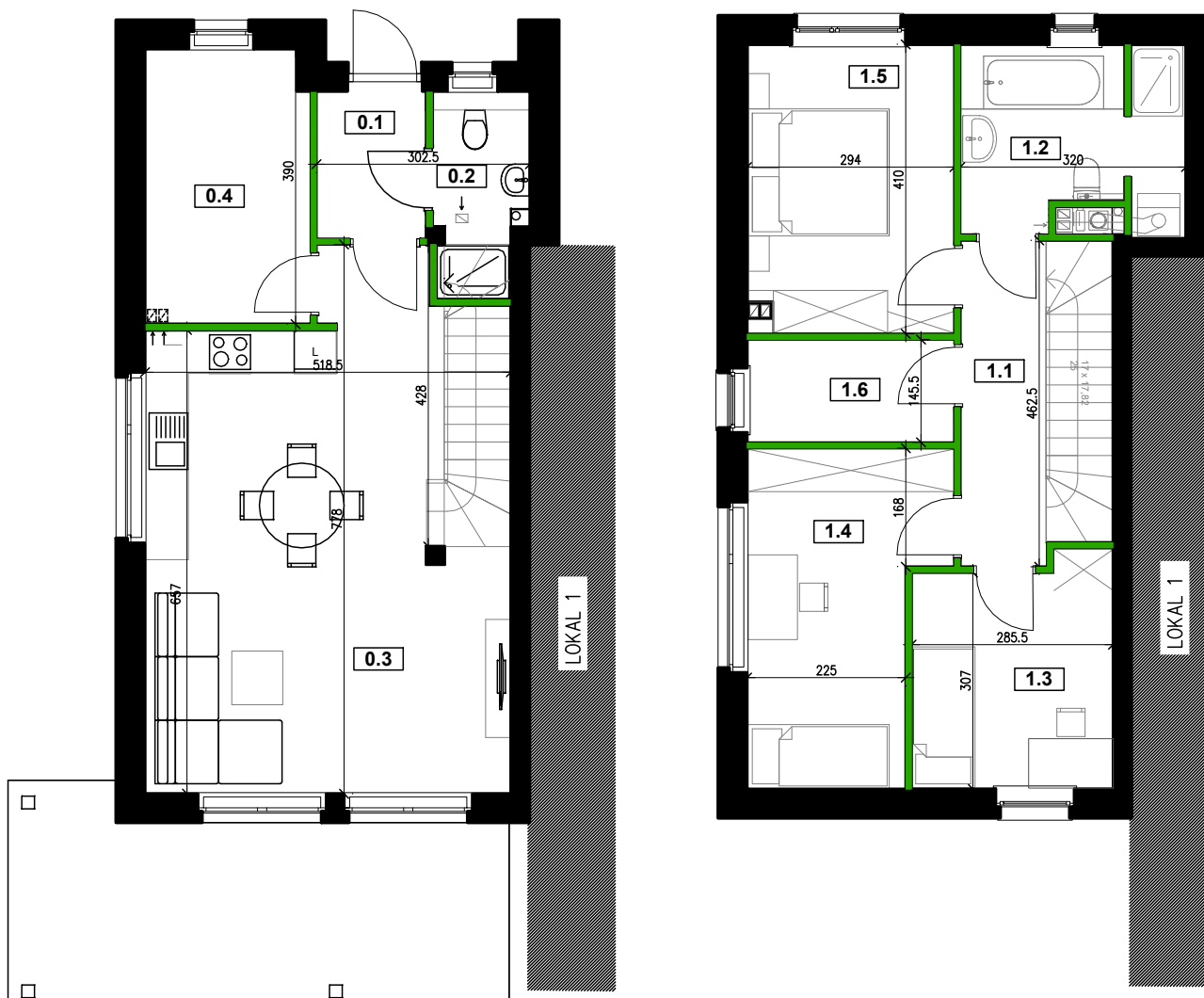
LOKALIZACJA, lokal nr 2