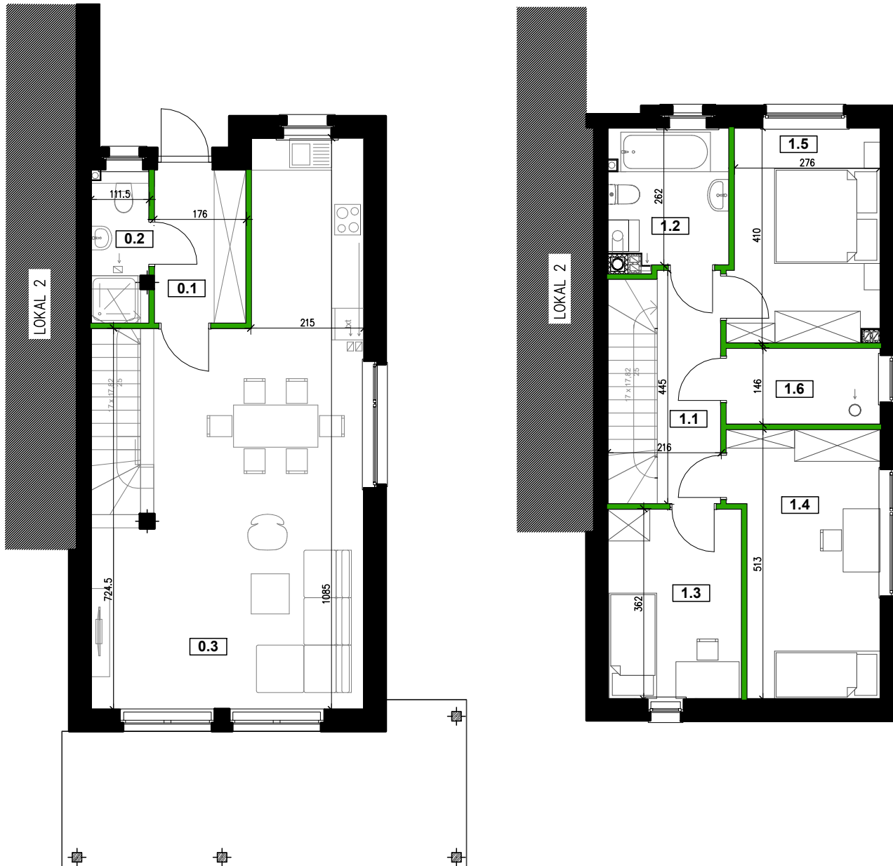
LOKALIZACJA, lokal nr 1